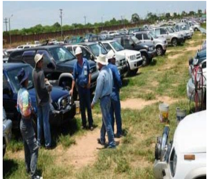
La economía nacional bajo el Gob. del MAS se basa también en la legalización de autos chatarra, contrabando, robados, etc.

La importación y nacionalización de autos chutos no agrega